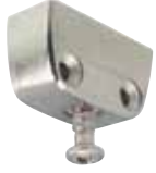
RV bağlantı dış parçası